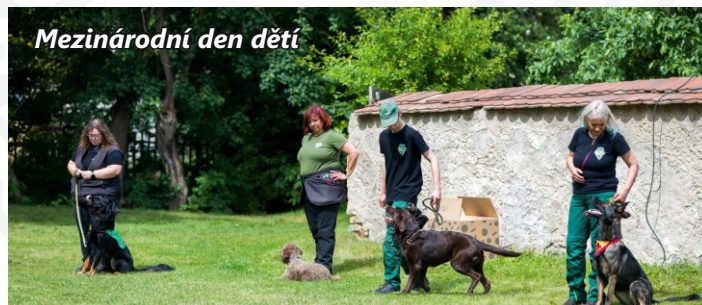
Mezinárodní den dětí