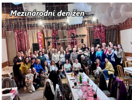
Mezinárodní den žen