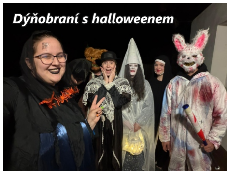
Dýňobraní s halloweenem