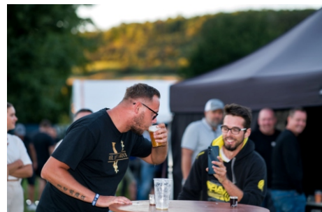
Putování za pokladem