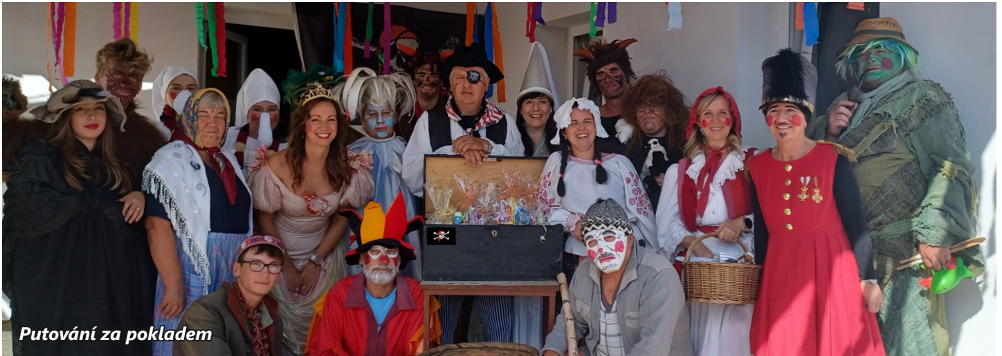
Putování za pokladem