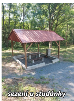
sezení u studánky