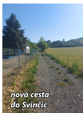
nová cesta do Svinčic