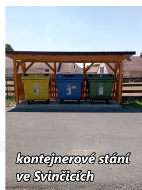
kontejnerové stání ve Svinčicích